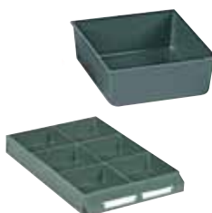
Ejemplo de composición. No incluye cajón.

Exteriores: (HxAxF) 41 x 111 x 103 mm Capacidad cajón: 6 Material: Poliestireno Color: verde Peso: 0,04 Kg