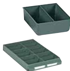
Ejemplo de composición. No incluye cajón.

Exteriores: (HxAxF) 41 x 111 x 103 mm Capacidad cajón: 6 Material: Poliestireno Color: verde Peso: 0,05 Kg