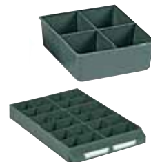
Ejemplo de composición. No incluye cajón.

Exteriores: (HxAxF) 41 x 111 x 103 mm Capacidad cajón: 6 Material: Poliestireno Color: verde Peso: 0,06 Kg