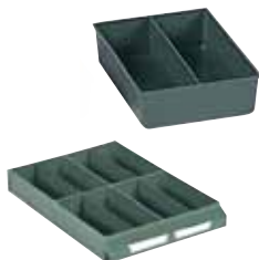
Ejemplo de composición. No incluye cajón.

Exteriores: (HxAxF) 41 x 111 x 154 mm Capacidad cajón: 4 Material: Poliestireno Color: verde Peso: 0,07 Kg