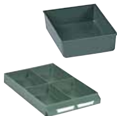
Ejemplo de composición. No incluye cajón.

Exteriores: (HxAxF) 41 x 111 x 154 mm Capacidad cajón: 4 Material: Poliestireno Color: verde Peso: 0,06 Kg