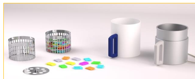
Componentes y accesorios

STP 120-3: STP 120-2 + 3 er baño de parafina y 2 a cesta de acero inoxidable para 120 casetes adicionales.