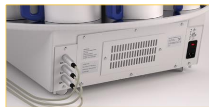
Filtro de carbón activo