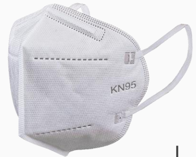
One Size / Unitalla

Tejido no tejido, antibacteriano, de aire caliente, tela soplada por fusión. Diseño 3D según el contorno de la cara, aumenta el espacio para boca y nariz, reducen la resistencia respiratoria. Ajuste facial para adultos