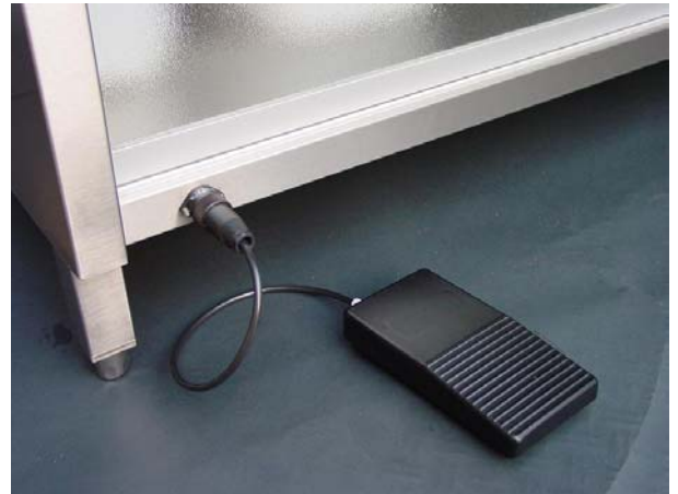
Pedal dispensación de formol

Válvulas accionadas por pedales, para la dispensación de agua caliente y fría. Ubicados convenientemente a voluntad del usuario para su fácil alcance.