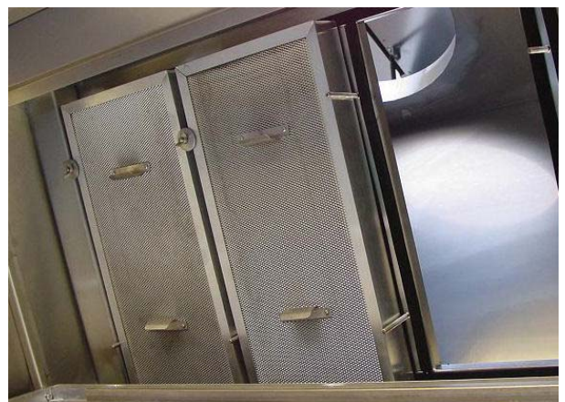
Panel de cajetines de filtros