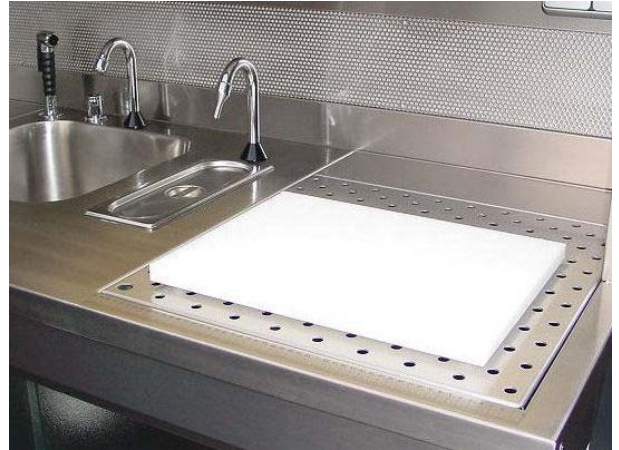
Superficie de trabajo