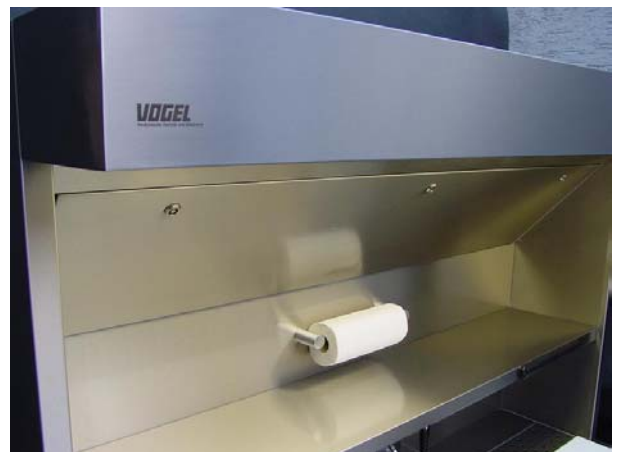
Porta Rollos de toallas de papel