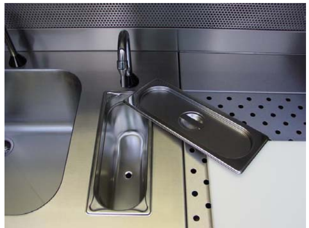
Pileta y dispensador de formol